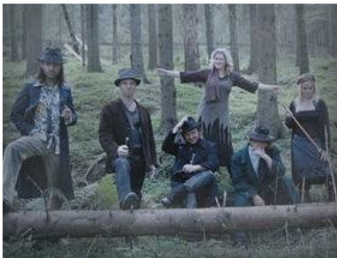
Omslaget på Nordagust debutalbum fra 2010, In the mist of morning , som også er navnet på det første sporet på CD-en. Til høyre selve bandet, som de fleste vel allerede har antatt.

Ellers betyr visst nordagust nordavind. Men på bandets hjemmesider står det at nordagust dreier seg om gamle forestillinger om nordavindens ånd. I så fall har vi vel en morsom etymologisk forbindelse til tyske ”geist” og engelske ”ghost”, som betyr ånd og til og med spøkelse.