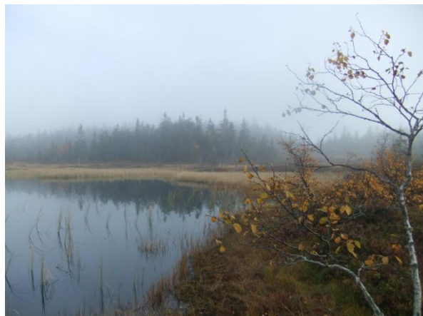
Hester i Stange i oktobersol, og Årkjølen i morgenskodde dagen etter før det klarnet opp.